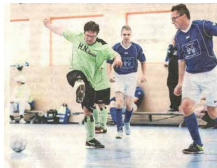
▲ Het gaat er fanatiek aan toe in De Muizenberg.

„Natuurlijk willen ze allemaal graag winnen, maar het gaat vooral om het plezier in het spelletje”, zegt Heymen. „Sportiviteit staat hoog in het vaandel. Daar kunnen wij nog een voorbeeld aan nemen. Als de scheidsrechter fluit, is het negen van de tien keer voor een doelpunt. En raken ze de tegenstander per ongeluk een keer verkeerd, dan geven ze elkaar de hand en spelen ze weer lekker verder.”